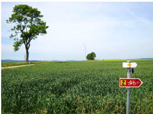
Beginn des Wanderweges

Vom Bahnhof Engen fahren wir über Zimmerholz nach Stetten. Dort folgen wir der Straße nach Leipferdingen. Wir parken auf dem höchsten Punkt vor den drei Windkraftträdern auf einem geteerten Wirtschaftsweg.