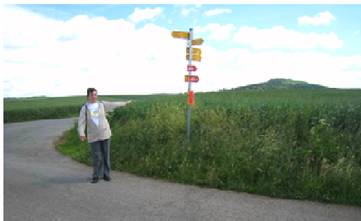
Kreuzung des Wanderweges

Zu der wohlverdienten Einkehr fahren wir mit dem Pkw dann wieder zurück nach Stetten, ca. 800 m.